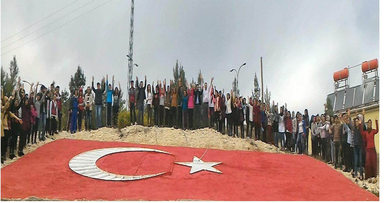
AL BAYRAĞIM TDP PROJESİ