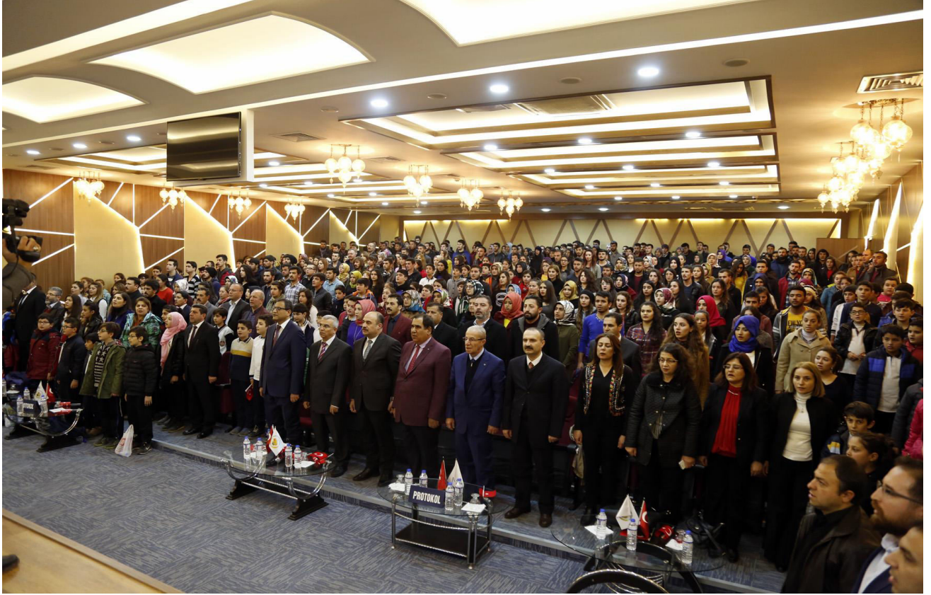
Saygı Duruşu ve İstiklal Marşı