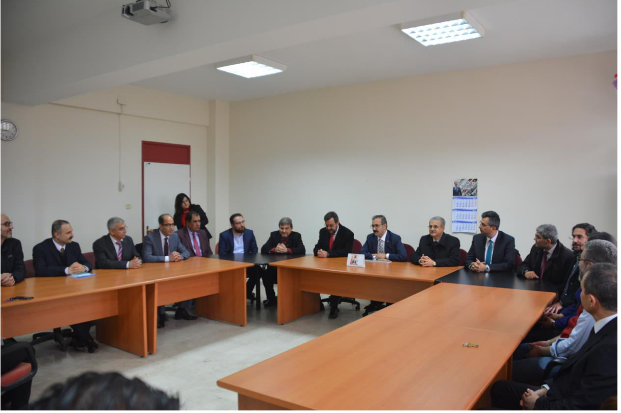
Sayın Rektörümüz ve Nizip MYO Personeli