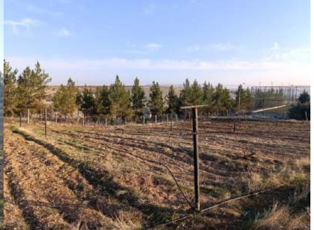
Bağ alanından görüntüler